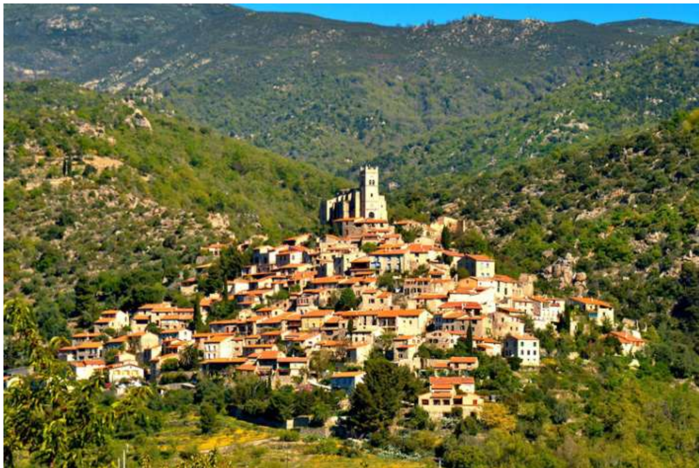
Village d'Eus Pyrénées Orientales (66)