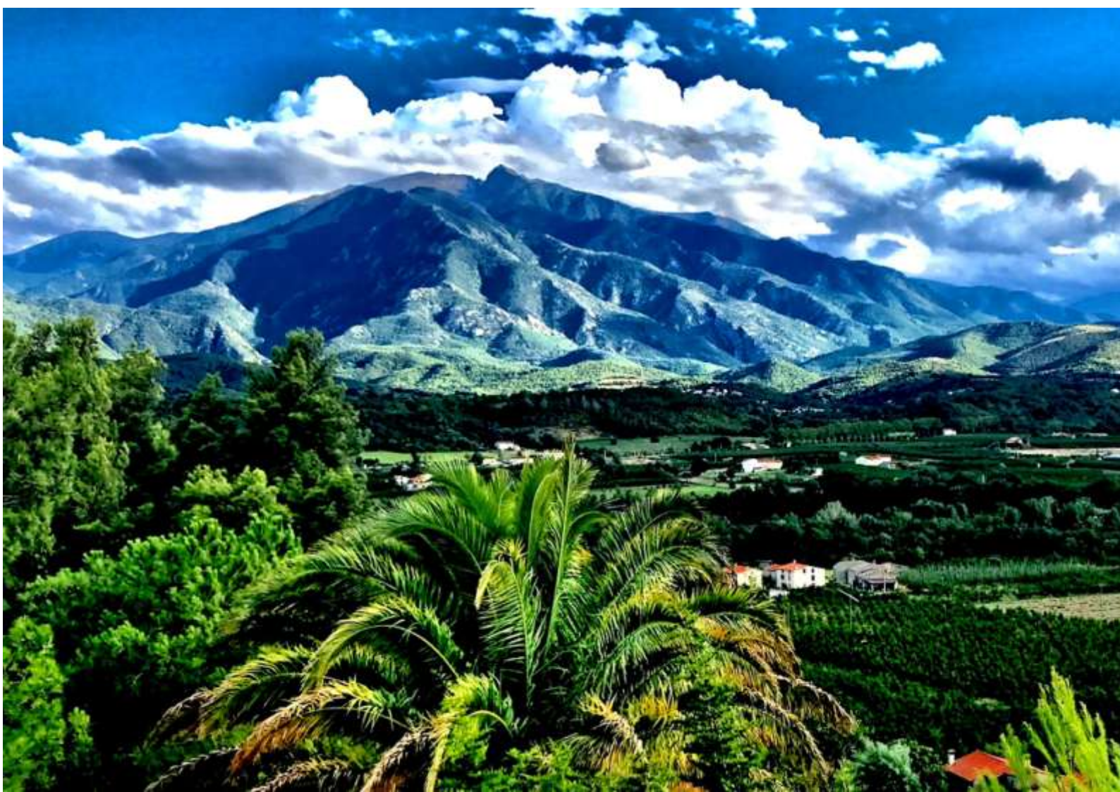
Vue de la terrasse de la Casa ilicia à Eus (66)

Guide Nature et Culture proposé par la Casa Ilicia